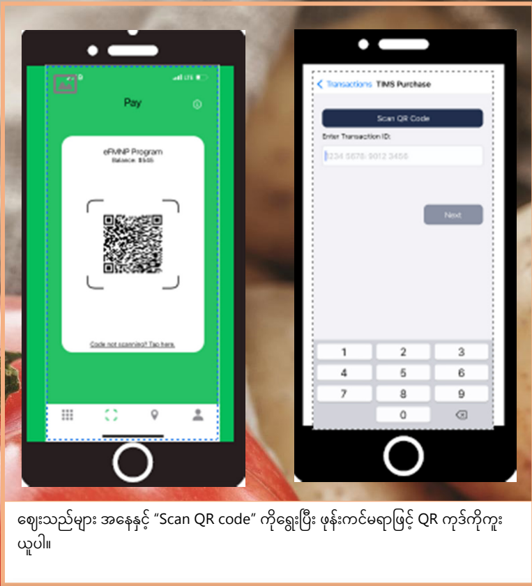
ဈေးသည်များ အနေနှင့် "Scan QR code" ကိုရွေးပြီး ဖုန်းကင်မရာဖြင့် QR ကုဒ်ကိုကူးယူပါ။

စမတ်ကိရိယာ မရှိသော အကျိုးခံစားခွင့်ရရှိသူများအတွက် QR ကုဒ်ကို စာရွက်ထုတ်ထားပေးသည်။ ဈေးသည်များအနေနှင့် QR ကုဒ်ကို အလားတူ ကူးယူနိုင်သည်။